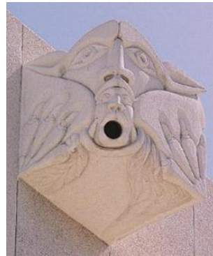
O bem e o mal