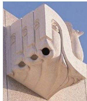
A guerra e a paz