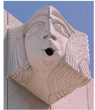
O guarda das ondas hertzianas