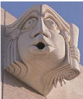
O guarda dos papiros