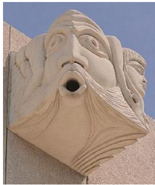
O novo, o velho e a morte