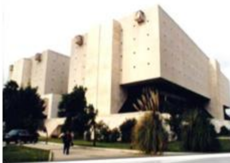
Direcção-Geral de Arquivos Arquivo Nacional da Torre do Tombo

O edifício da Torre do Tombo foi inaugurado em 1990 e apresentou candidatura a património nacional classificado.