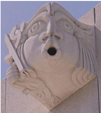
O guarda do alfabeto