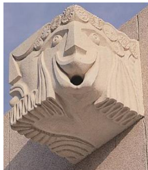
A tragédia e a comédia