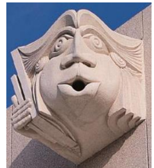
O guarda das pedras